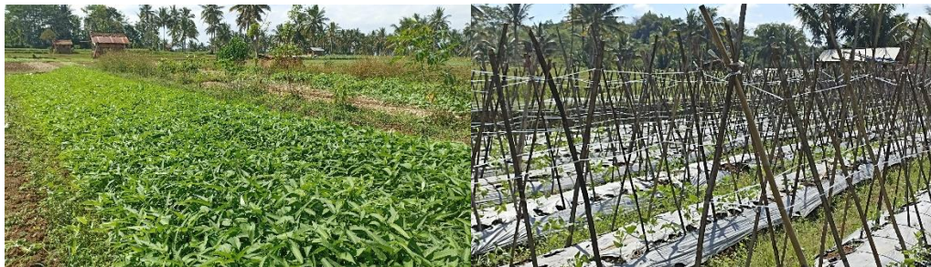
Gambar 1. Potensi Sayur di Desa Sukorambi Kecamatan Sukorambi Kabupaten Jember

dan cakupan hortikultura lainnya seperti buah buahan ( pomology ), pertamanan ( landscape horticulture ), bunga dan tanaman hias ( floriculture ). Tujuan menanam sayur adalah untuk memenuhi kebutuhan rumah tangga, untuk keperluan komersil dan juga untuk mendapatkan profit. Sedangkan menurut kajian Rahmawati & Fariyanti (2018) bahwa tanaman sayur seringkali mengalami peningkatan pasokan yang menyebabkan terjadinya penurunan pada harga tanaman sayur atau fluktuasi harga dan juga mengakibatkan petani sayur tidak mendapatkan kepastian pendapatan dalam kondisi tersebut. Dua penyebab adanya fluktuasi harga tersebut yaitu jenis tanaman yang cenderung sama dan faktor musim.