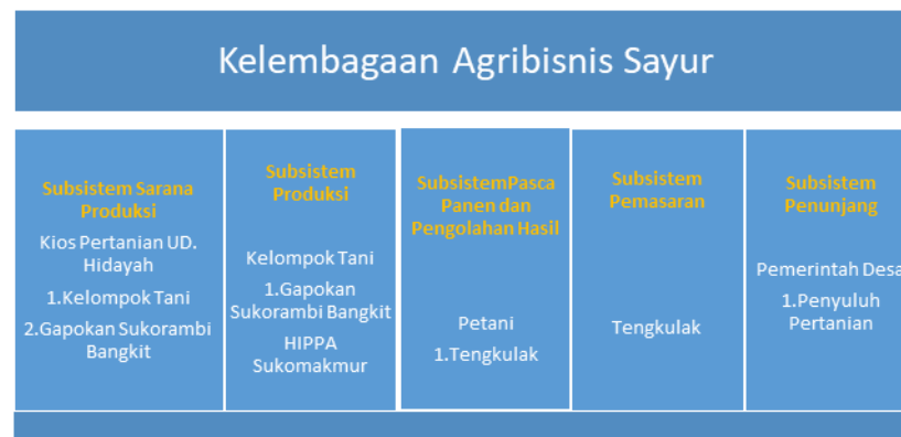
Gambar 3. Kelembagaan Agribisnis Usahatani Sayur di Desa Sukorambi

Berdasarkan Gambar 3, bahwa kelembagaan Agribisnis Sayur Daun di Desa Sukorambi adalah sebagai berikut: